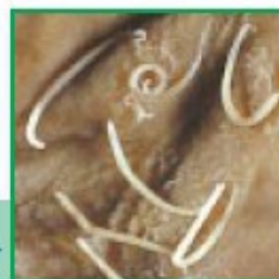
Trichures sur muqueuse intestinale

Demandez conseil à votre vétérinaire qui saura vous prescrire le traitement adéquat.